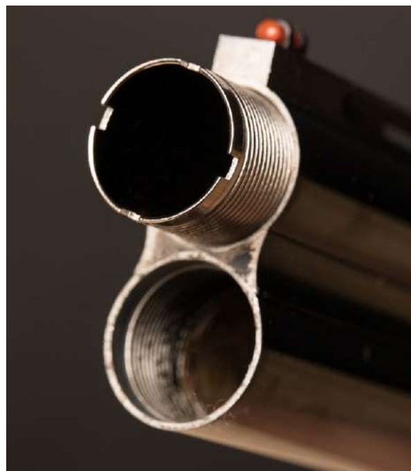
Trangboringer kommer i ulike varianter, og kan på mange våpen byttes ved at man skrur inn choker foran i løpet.

Det hagla mangler av presisjon tar den igjen i effekt. På kort hold er et haglekudd svært dødelig, både for større og mindre dyr. Men den er ikke særlig effektiv på avstander over 45 meter. Haglegevær brukes også til skyting på flygende fugl og løpende småvilt.