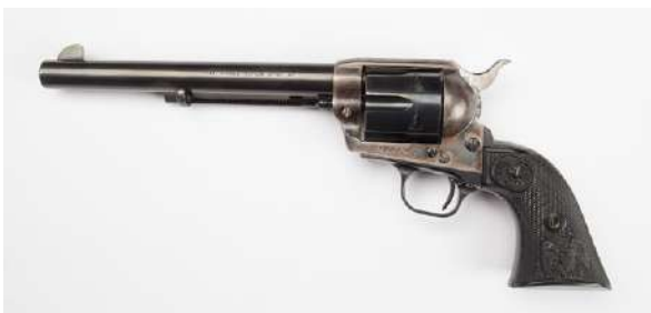
Samme revolver i hel utførelse.