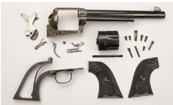
Hoveddelene i en revolver: Rammestykke med løp, hane, tønne, grepstykke og grep. Øvrige deler utgjør mekanismen i denne single action-revolveren.