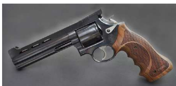
Revolveren er en pistol med fast løp og roterende sylindrisk magasin, som kalles tønne. Denne har konkurransesikter og matchgrep.

Revolver er i prinsippet en pistol med revolverende magasin. Det er vanligst at revolveren har tønne som tar 6 patroner. I store magnumrevolvere er det ofte bare 5, mens det i revolvere i .22 LR ikke lengre er uvanlig med 10 patroner i tønna.