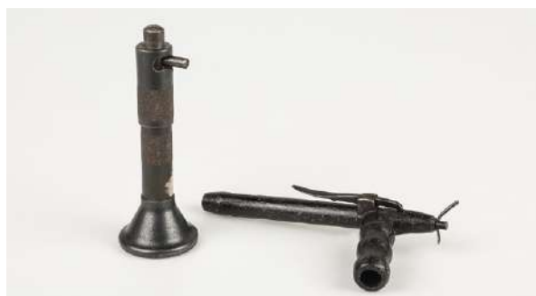
Slaktemasker kommer i ulike utførelser.