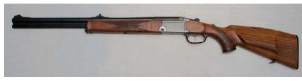
Kombinasjonsvåpenet har både hagle og rifleløp.

Kombinasjonsvåpen er som regel rene jaktvåpen, og består gjerne av et rifleløp og et hagleløp, eller et rifleløp og to hagleløp. Men løpskonfigurasjonen kan også være annerledes, for eksempel to løp med ulike riflekalibre og et hagleløp. Har våpenet tre løp kalles det drilling, og har det flere er det en firling. Det finnes også kombier som kommer med flere løpssett tilpasset samme låskasse, slik at eieren kan bytte mellom rifle/hagle, hagle/hagle og rifle/rifle. Kombinasjonsvåpen har brytemekanisme. Kombiens fordel er at du har ett hagle-skudd og ett rifleskudd. Dermed kan du skyte på både flygende og sittende fugl. En drilling har som regel to hagleløp og et rifleløp, og fungerer som en dobbeltløper