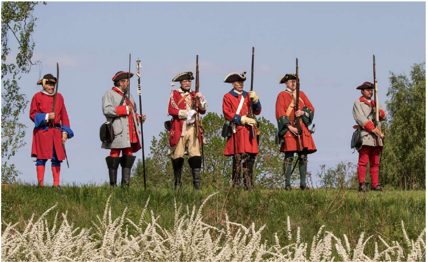
Skytevåpen har lang historie i Norge, både som jaktvåpen og til militært bruk. Disse karene viser hvordan det norske Forsvaret var på 1800-tallet, med fargerike uniformer og flintlåsgeværer.