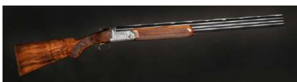
Dobbeltløpede hagler har to enkeltskuddsmekanismer.

fordel er at skytteren raskt kan avfyre to skudd. Dobbeltløperen kan ha en eller to avtrekkere. Har den en avtrekker sitter det som regel en løpsvelger på våpenet, slik at skytteren kan velge hvilket løp som skal avfyres først. Eksempler på enkeltskuddshagle med ett løp: Henry 1512 og Browning BT-99. Eksempler på enkeltskuddshagler med dobbelt løp er: Beretta 686, Browning Cynergy og Blaser F16.