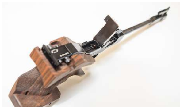
Fripistolen er et eksempel på en enkeltskuddspistol.

Fordelen med de moderne enkeltskuddspistolene er at de har langt løp og solid mekanisme. Fripistoløvelsen skytes på samme presisjonsskive som 25m-øvelsene og krever derfor optimal tilpasning av våpen. Pipa er derfor lang, noe som gir høyere fart på kula og lengre siktelinje. I metallsilhuett benyttes våpen med samme mekanisme som boltrifler. Kombinert med langt løp gir det mulighet for gode treff på langt hold. I de nevnte svartkruttklassene er det bare enkeltskuddspistoler som er tillatt.