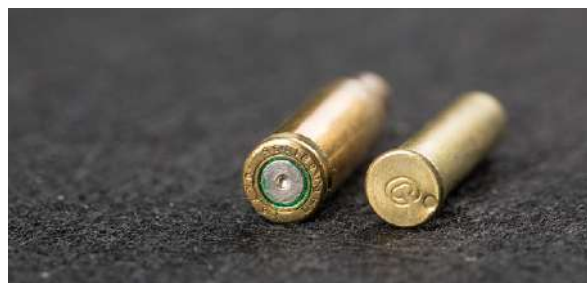
Patronen til venstre har sentertemming, mens patronen til høyre har randtemming.

med svartkrutt. Hylsene finnes både med flaskehals og som helt sylindriske. Prosjektilet velges ut fra bruksområde. Til blinkskyting er helmantel vanlig, mens det til storviltjakt skal brukes ekspanderende prosjektil.