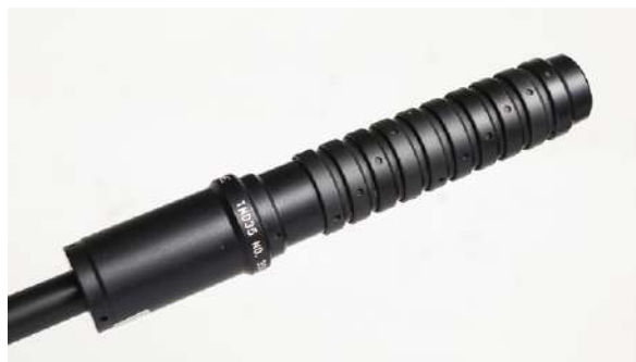
Lyddemperen skrues på foran på pipen og demper både smell og rekyl.

Lyddemperen skrues på pipa foran og demper lyden noe. Hensikten med lyddemperen er å hindre hørselsskader, først og fremst på jakt da de fleste jakter uten hørselsvern. Lyddemperen har spor for gjenger, og løpet må gjenges for å montere demperen. Dette er arbeid som må gjøres av fagfolk. Gjøres det dårlig arbeid med monteringen, risikerer skytteren at lyddemperen skytes i stykker. På grunn av økt lengde på våpenet og endret balanse kapper mange pipa før de monterer demper. Lovlig pipe-lengde og total lengde på våpenet skal da måles uten demperen montert. Lyddemperen demper også rekylen merkbart. Den største ulempen er at den som regel gir treffpunktforandring og at den raskere blir varm noe som kan gi varmhildring. Sistnevnte er varm luft som stiger opp fra demperen og reduserer sikten til skytteren.