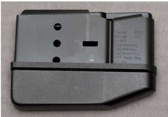
Magasin er enten innebygget, er hengslet eller sitter løst, slik som på dette bildet. Mange våpen mangler magasin.

Magasiner finnes til rifler, hagler og pistoler. Til revolver er tønna et magasin. Magasiner leveres