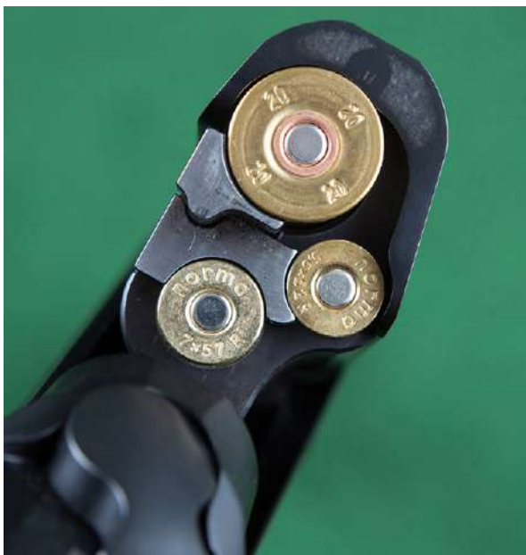
Dette kombivåpenet består av et hagleløy og to rifleløy i ulike kalibre.

hagle med et rifleløy i tillegg. Eksempler på kombinasjonsvåpen: Blaser BBF 97, Sabatti kombi og Finn Classic 512.