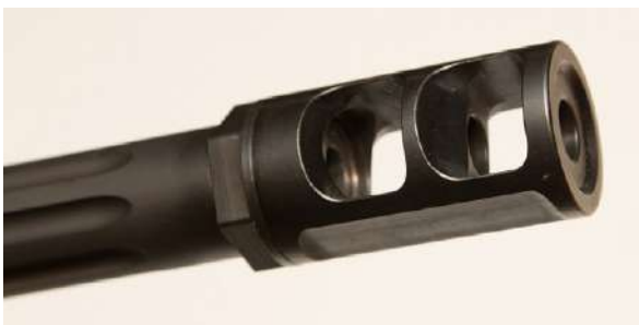
Rekyldemperen demper rekyl, men forsterker smellet og som regel spruter det ut til sidene.

I de senere årene har stadig flere jegere gått over til kraftigere kalibre på storviltjakt. For mange er det en delt opplevelse. På den ene siden gjør mer kraft at store dyr går raskere i bakken, på den andre siden kan rekylten oppleves som ubehagelig. Derfor bruker noen rekyldempere, for å få mindre vondt i skuldra når våpenet avfyres. Ulempen er at denne forsterker smellet, og den blåser kruttgass og flammer ut til sidene. For sidemannen til en skytter med rekyldemper kan dette være ubehagelig, og derfor er rekyldemper forbudt på mange skytebaner i Norge.