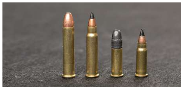
Randtenningspatronene som benyttes mest i dag er finkalibre. På bildet de fire vanligste. F.v: .22 WMR, .17 HMR, .22 LR og .17 WMR.