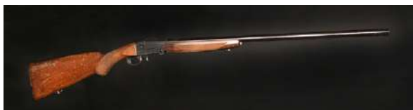
Enkeltløpede hagler har en enkeltskuddsmekanisme.