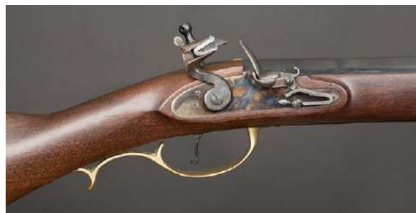
Gnisten fra flintsteinen antenner kruttet i flintlåsvåpen.