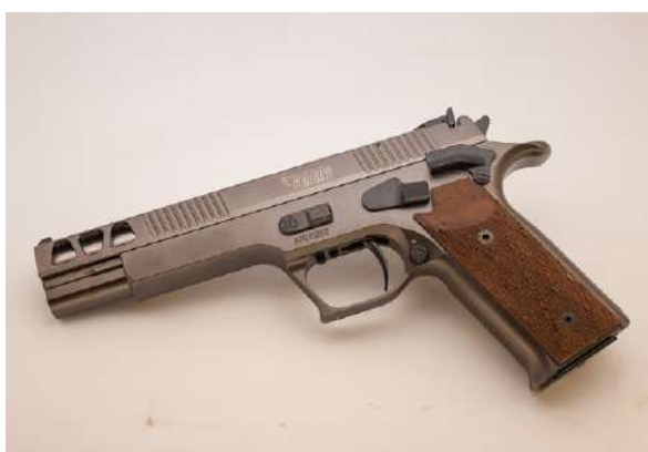
Samme pistol i sammensatt utgave.