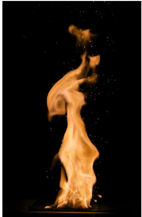
Røyksvakt krutt som brenner.

Luftvåpen drives enten av trykkluft eller CO 2 -gass. Trykket som oppstår ved avfiring skyter prosjektilet ut av løpet.