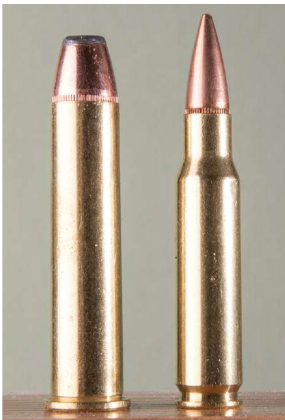
Patroner kan enten være rettveggede eller ha flaskeform.