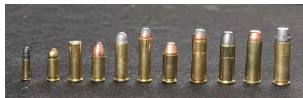
Noen kalibre for pistol og revolver. En .22 LR for størrelsesreferanse. Fra venstre: .25 ACP, .32 S&W Long, 9mm, .38 special, .357 Magnum, .40 S&W, .44 – 40, .44 Special, .44 magnum og .45 Long Colt.

Patroner for pistoler og revolvere har som regel sylindriske hylser, men noen har flaskehylser. Patroner kommer både med og uten krave, som er en utstikkende rand i hylsebunnen. Denne ble opprinnelig konstruert for at patronen skulle henge på kraven når den ble satt inn i en revolvertønne, men det finnes også til pistoler, blant annet .32 SWL og .38 special. Kalibre for pistol og revolver angis på tilsvarende måte som for rifle. Vær oppmerksom på at flere kalibre kan skytes i samme våpen, for eksempel kan .38 special skytes i revolvere kamret for .357 magnum.