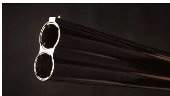
De vanligste løpskonfigurasjonene på hagler: Enkeltløper, sideligger og over/under.

våpen. Men det finnes flere typer haglemekanismer, og hver av dem har sine fordeler og ulemper.