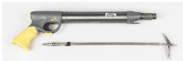
Harpun er lovlig, enten det er strikkdrevet eller gassdrevet slik som den på bildet.