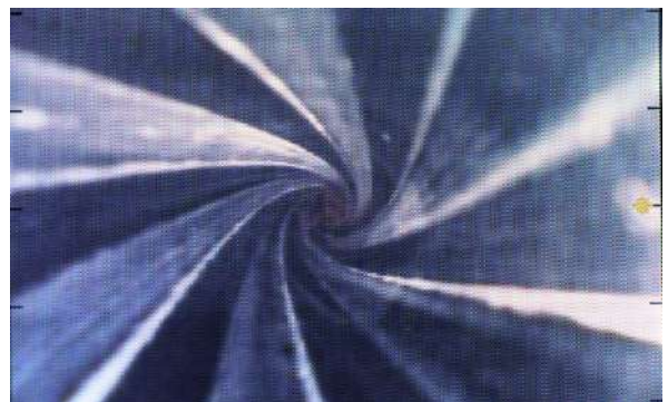
Slik ser riflingen ut inne i et rifleløp.

Piper kommer i ulike utførelser. Korte piper gir mindre hastighet på prosjektilet enn en lang pipe, dersom ammunisjonen er den samme. Tynne piper blir raskere varme enn tykke piper, noe som primært bare har betydning når det skytes flere skudd på kort tid.