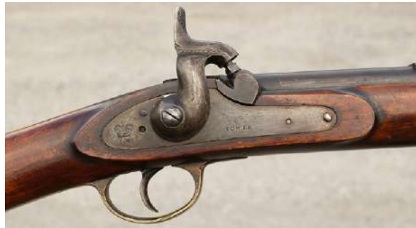
Svartkruttvåpen produsert før 1890, slik som denne, er ikke registreringspliktig.