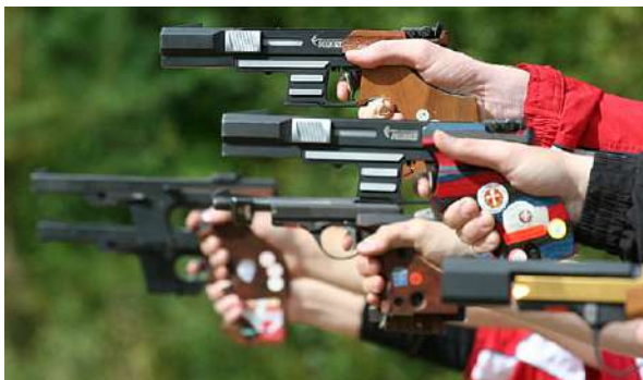
Pistoler brukes til konkurranseskyting. På bildet skytes det felt.

De første pistolene kom på 1500-tallet og var i prinsippet avkappede geværer. Mest sannsynlig ble pistolen til på bakgrunn av behov for et våpen som kunne holdes i en hånd. Første bruksområde