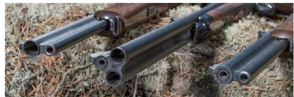
Kombinasjonsvåpen har minimum to løp.