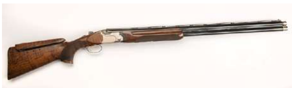
Samme hagle montert.

skinne som ligger over løpet. I den senere tid har det blitt mer populært med optiske sikter til hagle, blant annet rødpunktsikter.