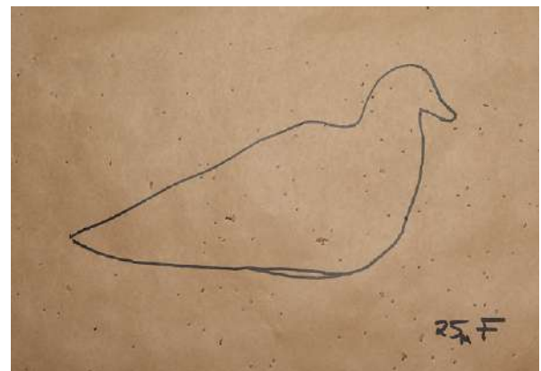
Hagleskudd avfyrt på 25 meter med full trangboring. Her sitter skuddene ganske tett.