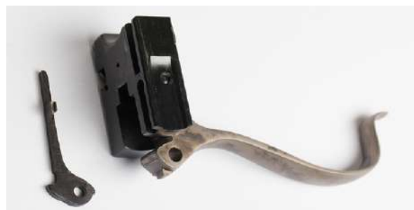
Låseblokken beveger seg vertikalt i forhold til løpets lengde. Når blokka trekkes ned, kan patron lades i kammeret.

Sluttstykket er en bevegelig del i et skytevåpen som har til hensikt å hente patroner fra magasinet og føre dem frem til kammeret. Sluttstykket skal også lukke og låse mekanismen før avfiring. Støtbunnen i sluttstykket utgjør bakre del av våpenets kammer. På halvautomatiske pistoler er glidestykket våpenets sluttstykke. Låseblokk er et sluttstykke som ikke beveger seg i løpets lengderetning. Eksempel er fallblokk, som beveger seg i løpets høyderetning.