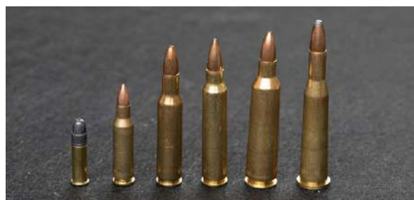
Noen finkalibre riflepatroner med sentertemming. En .22 LR for størrelsesreferanse. F.v: .17 Bee, .222 Remington, .223 Remington, .22 – 250 og 5,5 x 52 R.