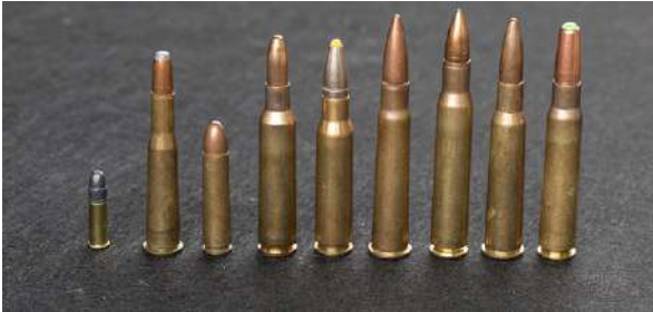
Noen riflekalibre i medium størrelse. En .22 LR for størrelsesreferanse. F.v. .25 – 55, .30 US, 6,5 x 55, .308 Winchester, .303 British, .30 – 06 Springfield, 7 x 57R og .8 x 57JS.