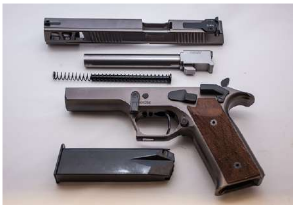
Pistol strippet for pussing. Delene er glidestykke, pipe, fjær og styrepinne, rammestykke med grep og avtrekk og magasin.