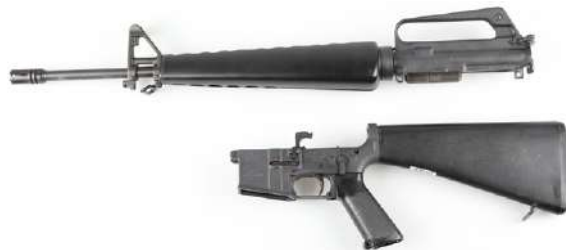
Halvautomatisk rifle delt i upper receiver (øverst) og lower receiver (nederst).

slagfjær, som igjen spenner opp en tennstift. Når haglegeværet lukkes og avtrekkeren presses inn, frigjøres tennstiften og patronen i kammeret avfyres. På halvautomatiske rifler av typen AR-15 og lignende er låskassen horisontalt todelt, i en såkalt upper og en lower receiver. Disse må settes sammen for at våpenet skal fungere. I dag er det bare lower receiver som regnes som låskasse og er registreringspliktig. Upper receiver følger som regel med pipa, og det er pipa som er søknadspliktig.