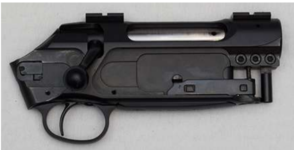
Låskasse med avtrekker, magasin og sluttstykke.

Låskassen er en hoveddel i rifla. Pipa er festet i låskassen, og sluttstykket beveger seg i låskassen. Avtrekkeren sitter som regel også i låskassen.