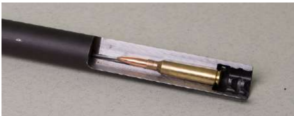
Patronen passer perfekt i kammeret i denne gjennomskårne rifle-pipa. Riflingen sees tydelig i løpet.

Betegnelsene pipe og løp blandes ofte når man snakker om skytevåpen. Det er egentlig ikke så nøyte, men her er de korrekte definisjonene: