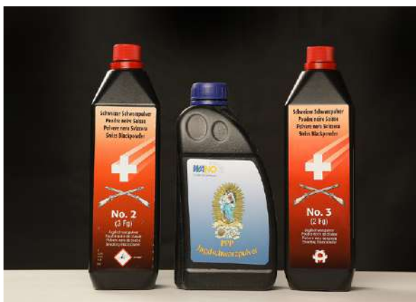
Det kan i private hjem oppbevares inntil tre kilo svartkrutt.

som antenner kruttet. Patroner med randtenning har en krage forsynt med tennsats rundt bunnen av patronen. Tennstemplet slår på kragen når patronen avfyres. Randtenningspatroner omlades som regel ikke etter at de er avfyrt. I patroner med sentertenning har en tennhette sentrert i midten av bunnen på patronen. Tennhetta ligger i en hette-lomme og avfyres når tennstemplet slår inn i hetta. Den kan støtes ut, og erstattes med en ny når patronen lades om etter å ha vært avfyrt.