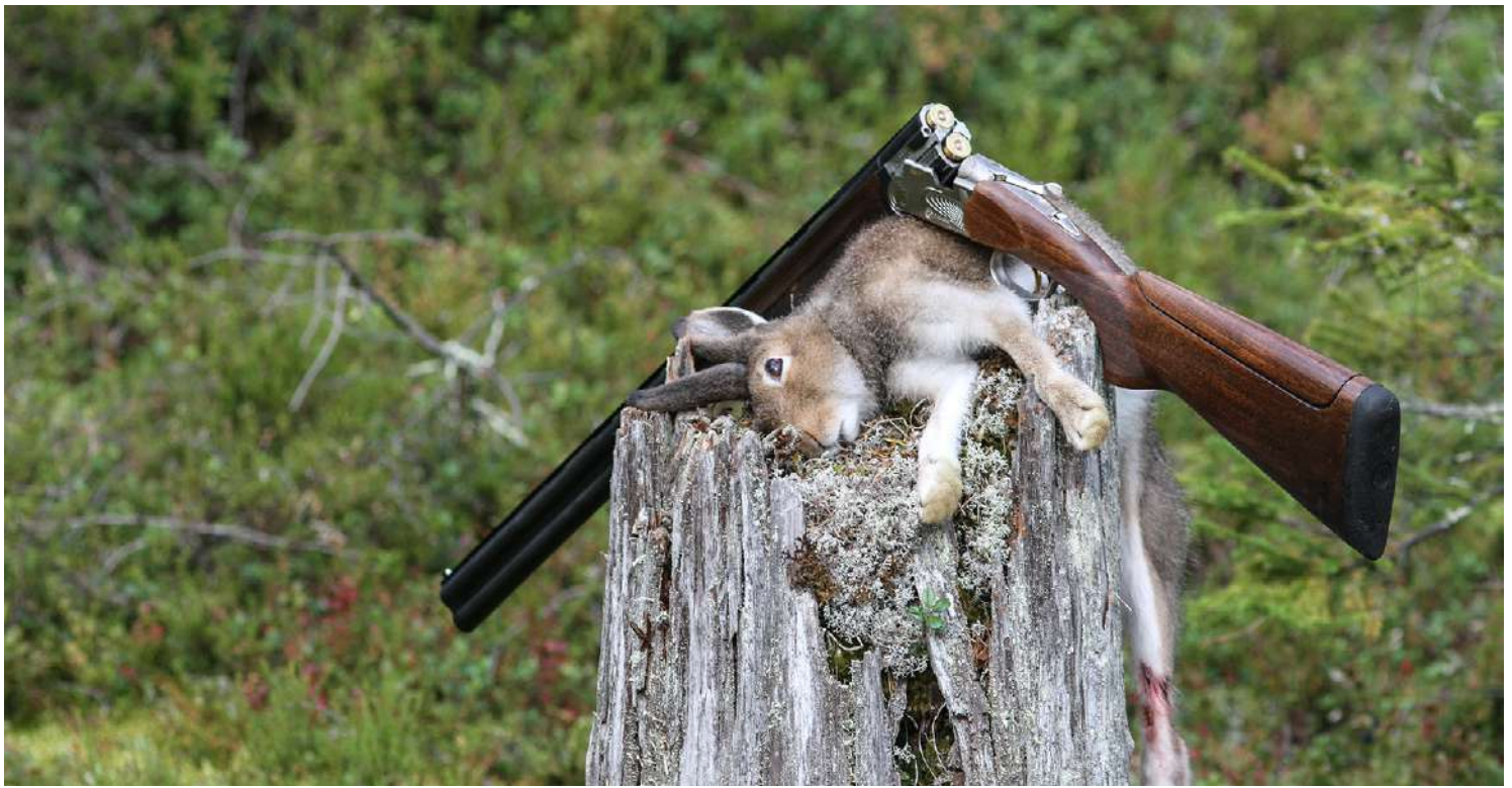
Hagla er vårt mest brukte våpen på mindre vilt, som for eksempel hare.

Haglesvermens samling kan reguleres ved ulik trangboring av løpet. Ved å snevre inn løpet litt i front samles haglsvermen bedre. Ulike trangboringer gir ulikt treffbilde. I noen hagler er trangboringen fast, i andre kan den byttes ut ved å skru inn en metallhylse i hvert løp – en såkalt choke. Chokene er gjenget og skrues inn og ut med en egen nøkkel. Fordelen med dette er å kunne optimalisere treffbildet på ulike avstander. En jeger som jakter rype tidlig i sesongen, når rypene trykker og flyr opp på korte hold, vil velge åpnere choke for å kunne treffe best mulig på kort hold. Senere i sesongen når rypene letter på lengre hold vil en trangere choke som holder svermen mer samlet være å foretrekke.