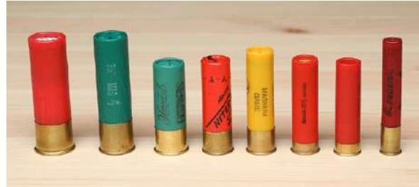
Haglepatroner i forskjellige kalibre.

Haglepatroner består av en hylse i papp eller plast, en bunnkopp i metall, tennhette, krutt, mellomledning og hagl. I hagl løp samsvarer ikke diameteren i løpet med benevnelsen. Grunnen er at haglekalibre fortsatt angis etter det gamle målesystemet som var i bruk før det metriske kom i 1875. Her ble kalibre på håndvåpen angitt i lødighet, som baserer