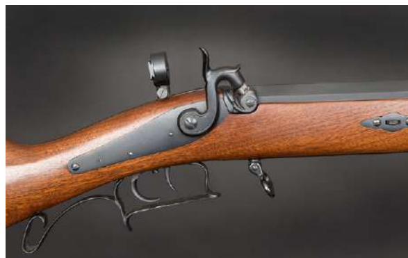
Hanen i et perkusjonsvåpen slår på hetta som antenner ladningen.