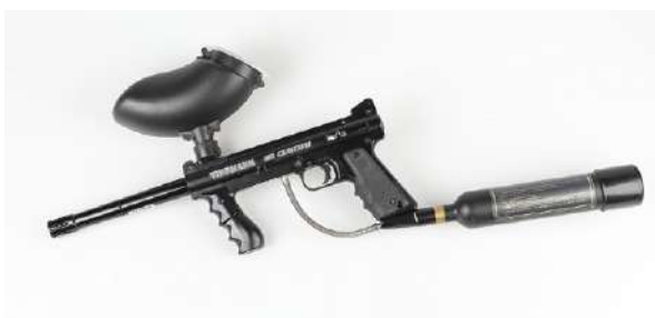
Paintballvåpen er lovlig, selv om de har større kaliber enn 4,5mm. våpen.