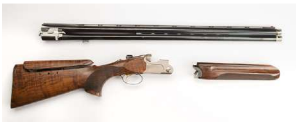
Dobbeltløpet over/under hagle demontert for pussing. Delene er løpssett, forskjefte og baskyle med avtrekker og bakstokk. Denne hagla har også justerbar kolbekam for bedre tilpasning for skytteren.