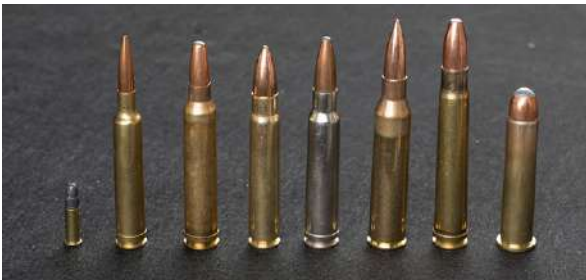
Noen riflekalibre i stor størrelse. En .22 LR for størrelsesreferanse. F.v. .240 Weatherby Magnum, .200 Winchester Magnum, 93 x 62, .338 Lapua Magnum, .375 Holland & Holland Magnum og .45 – 70 Government.

De fleste europeiske riflekalibre angis i mm, mens de amerikanske angis i tommer. Det er ikke uvanlig at amerikanske kalibre også benevnes med årstall og navnet på oppfinner. Eksempel på dette er .30-06 Springfield, hvor .30 angir kaliberet, 06 året 1906 da patronen ble lansert og Springfield er navnet på fabrikken som lanserte patronen. Den europeiske betegnelsen på samme patron er 7,62 x 63.