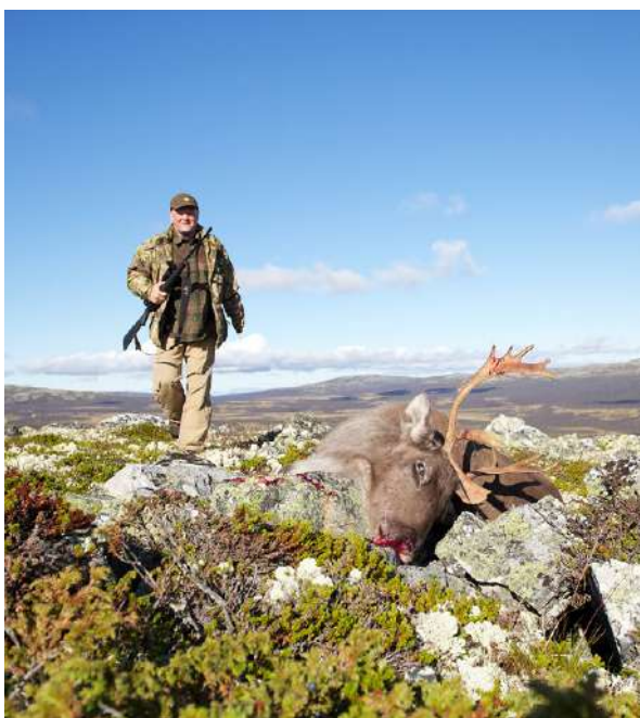
Rifla er et av våre mest brukte jaktvåpen på storviltjakt, f.eks. etter villrein, er rifle eneste lovlig jaktvåpen.

Det finnes utallige våpenvariasjoner. I gamle dager ble våpnene håndlaget, mens de i våre dager for det meste lages på samlebånd på fabrikker. Til tross for dette kan det være mange varianter av ett og samme våpen, og forskjellene angis som regel med forskjellige betegnelser på samme grunnmodell. For eksempel er halvautomatene Browning Bar og Browning Bar Match lik i grunnkonstruksjon, men spesifikasjonene gjør at det bare er den ene av dem som er godkjent i Norge.