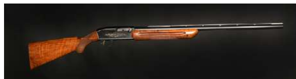
Halvautomatiske hagler lader om automatisk når patronen i kammeret er avfyrt.

Winchester 1897 og Benelli Supernova. Eksempler på bolthagle: Savage modell 220 og Toz 20.