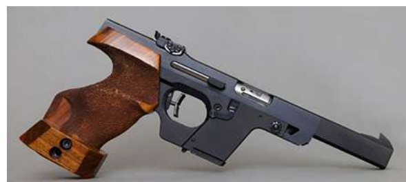
Halvautomatisk pistol i kaliber .22 LR. .

Det er stor forskjell på de rene konkurransevåpnene og de som bygger på militære konstruksjoner. Et konkurransevåpen vil som regel ha lav kjernelinje, optimal siktelinje, gode sikter, matchløp, matchavtrekk og ortopedisk grep. Dette er våpen som skal ha maksimal presisjon på 25 meter, og hvor tilpasningen av delene er gjort med små toleranser. Det kan gi funksjonsfeil om våpenet blir for skittent. Pistoler som bygger på militære konstruksjoner,