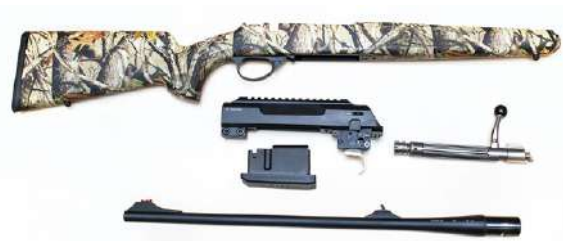
Boltrifle strippet ned til sine hoveddeler: Skjefte, låskasse, sluttstykke, magasin og løp.

Boltmekanisme: Bolt, også kalt sylinder, er vår vanligste mekanisme. Den består av et bevegelig sluttstykke som fører patronen inn i kammeret, og drar ut tomhylsen når patronen er avfyrt.