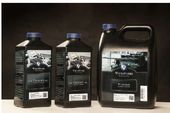
Det kan i private hjem oppbevares inntil fem kilo røyksvakt krutt.