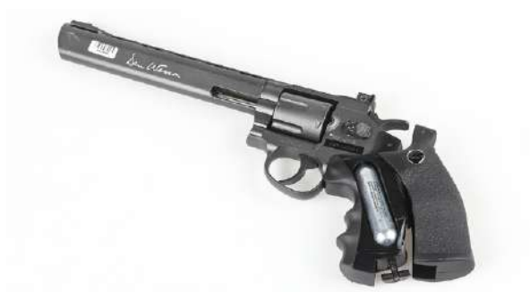
Luftgevær og luftpistoler drives av trykkluft eller CO2-patroner, som vist på bildet.