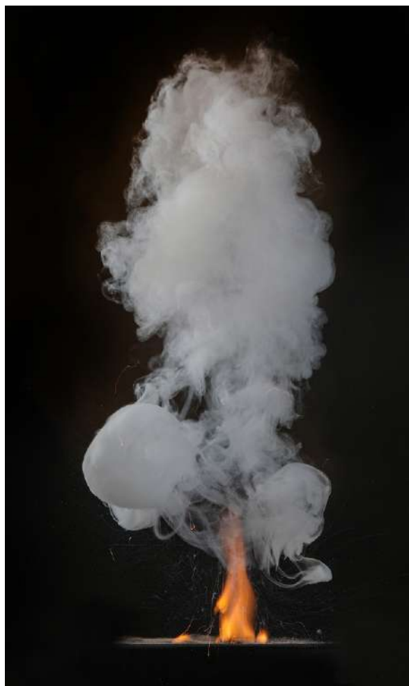
Svartkrutt som eksploderer.

Svartkruttet ble trolig oppfunnet i Kina på 800-tallet. Kruttet eksploderer når det antennes, og består av kaliumnitrat, trekull og svovel. Siden kruttet eksploderer utvikles det ikke et like kontrollerbart trykk som med røyksvakt krutt.