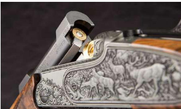
Rifle med brytemekanisme.

Brytemekanisme: Rifler med brytemekanisme kommer som enkeltskudd, dobbeltrifle, drilling eller flerløpet. Våpenet brekkes som en hagle, og patronen legges rett i kammeret. Når våpenet lukkes igjen er det klart til bruk. Enkeltskuddsriflas fordel er at den er liten og lett, og dermed enkel å ha med seg på jakt hvor du går mye. Dobbelttrifla er mye i bruk blant folk som har behov for raskt andreskudd, for eksempel ved jakt på farlig vilt. Eksempel på enkeltskudds bryterifler er Blaser