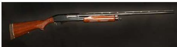
En repetèrhagle må lades om manuelt, enten som en boltrifle eller som denne som er en pumpehagle.

Repetèrhagler: Det finnes både pumpehagler og hagler med boltmekanisme. Disse er å regne som repetèrvåpen. Pumpehaglen krever manuelt lade-grep mellom hvert skudd, noe som skjer ved at forskeftet føres frem og tilbake. Fordelen med pumpehaglen er at den er rimeligere i innkjøp enn en dobbeltløper og det er som regel færre ting i en pumpemekanisme som kan føre til funksjonsfeil enn i en halvautomat. Hagler med boltmekanisme er i prinsippet konstruert som en rifle med samme mekanisme. Denne type hagler har som regel magasin og omladning skjer ved at sluttstykket manuelt føres frem og tilbake. Eksempler på pumpehagler: